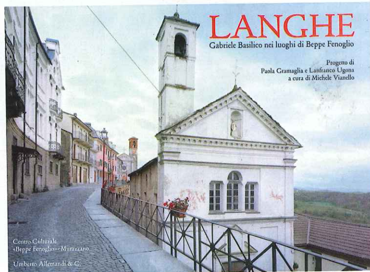
Centro Culturale «Beppe Fenoglio» - Murazzano Umberto Allentand & C.

Langhe. Gabriele Basilico nei luoghi di Beppe Fenoglio, Allemandi 2009, album formato 31 x 22, 95 pagine, 25 €.