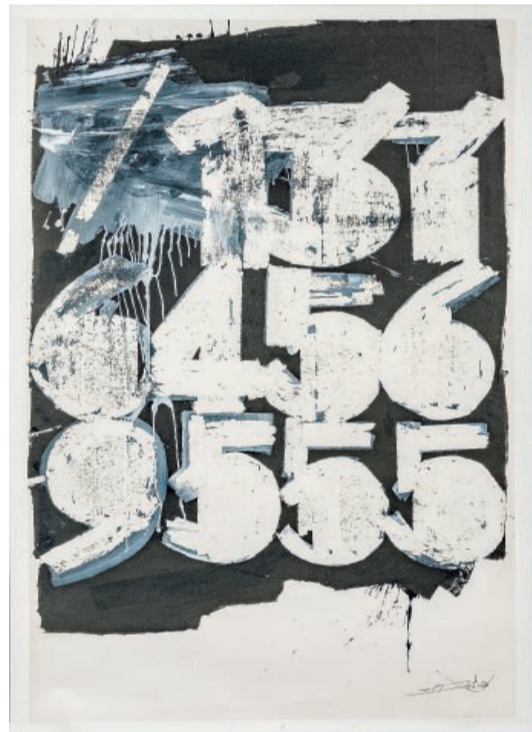
'My Mobile Number', 2013, cm 253,5 x 153 YANG XIAOJIAN

l'intera parete dello spazio espositivo, le più piccole sono di una decina di centimetri -, realizzate tra il 2004 e il 2021 e dipinte a inchiostro e acqua, occasionalmente ricorrendo anche a colori acrilici. Già questa descrizione materiale lascia capire come Yang Xiaojian sia rimasto comunque vicino all'arte calligrafica. Il ripensamento di questa tradizione riguarda lo stile e lo si può vedere, in mostra, in alcune opere che si incontrano già nella prima sala. Il primo, 'Boulder Pound the Clouds', mostra alcuni tratti fortemente destrutturati, nei quali si intuisce la presenza di tre ideogrammi (corrispondenti alle tre parole che compongono il titolo) solo perché ci viene spiegato. Il secondo è invece 'My Mobile Number' e - ha spiegato Vitale durante l'incontro con la stampa - aveva destato un certo stupore perché, invece di ideogrammi tradizionali, conteneva dei numeri arabi (quelli del numero di telefono dell'artista). Non stupisce che, come ha spiegato Ermotti, le opere di Yang Xiaojian non interessino particolarmente i collezionisti cinesi mentre quelli stranieri, e in particolare gli architetti, siano invece più interessati alla sua produzione.