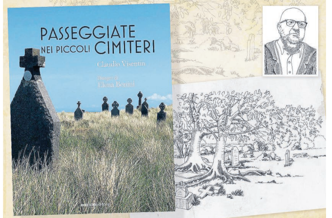
Luoghi di memoria